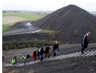
J4 : Bruay la Buisnière Visite du musée de la mine & Rando sur les terrils du Pays à part (8km D 130m pour tous)