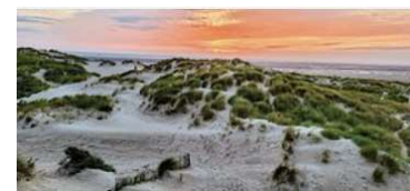
J7 : Le Touquet Rando dans la réserve de la Baie de Canche (16km D200m & 13km D150m) et visite de la ville