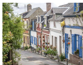
J3 : St Valery & Baie de somme Rando à la pointe du Hourdel (15 & 10km D10m) & visite de la cité médiévale