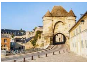
J1 : Laon Visite de la ville