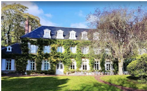
Manoir de la Canche 62140 Huby Saint Leu