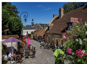
J2 : Montreuil sur mer & Berck Rando dans la Baie d'Authies (13km D 20m pour tous) et découverte des 2 cités